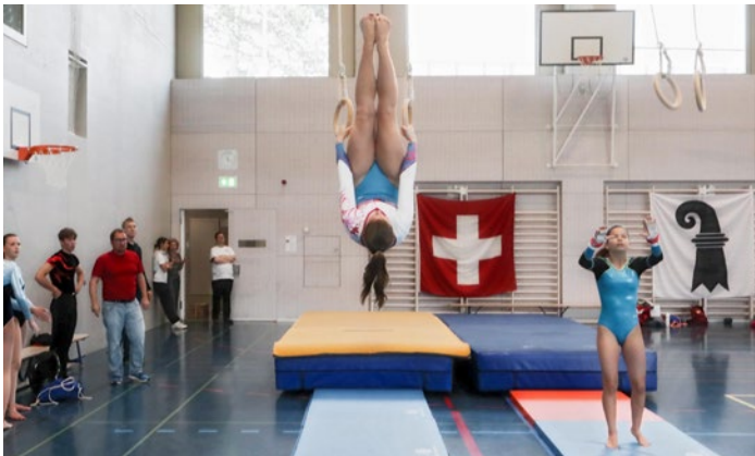
74 Turnerinnen und Turner beteiligten sich beim Geräteturnen