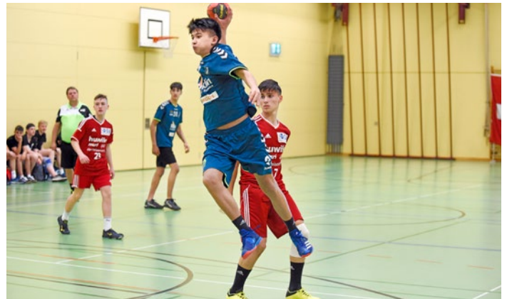
16 Mädchen- und 21 Knabenmannschaften gaben ihr Bestes