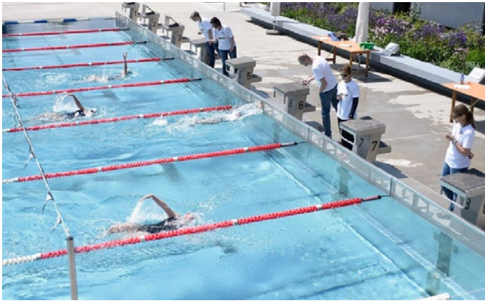
Spannende Rennen im kühlen Nass