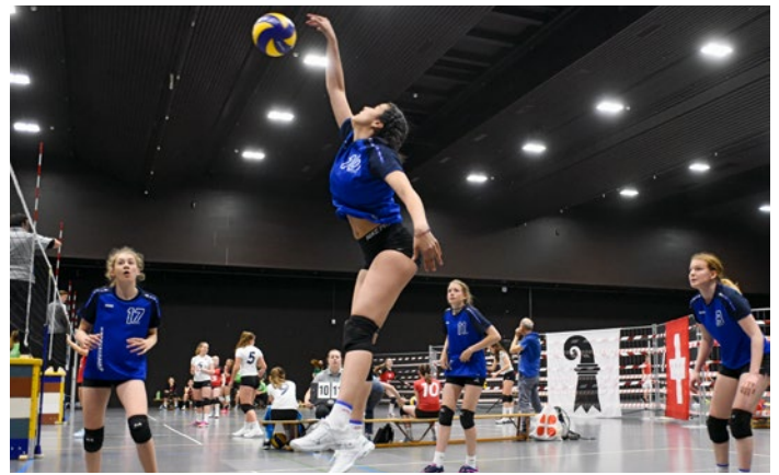
Für spannende Spiele sorgten die Volleyballerinnen und Volleyballer