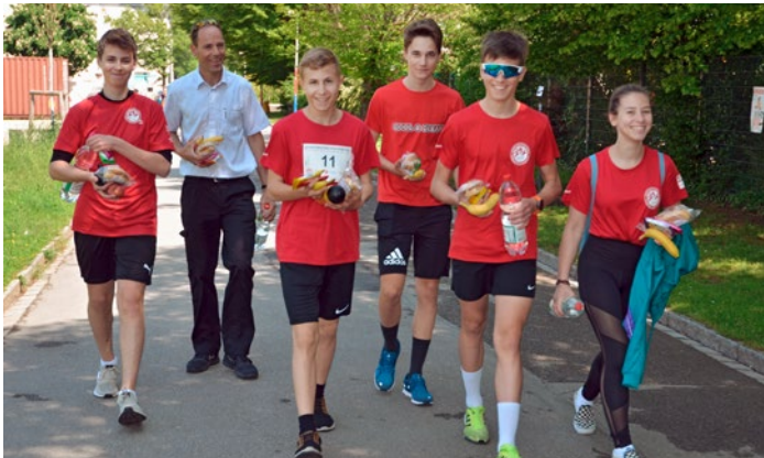
Energie Nachschub für den nächsten Einsatz