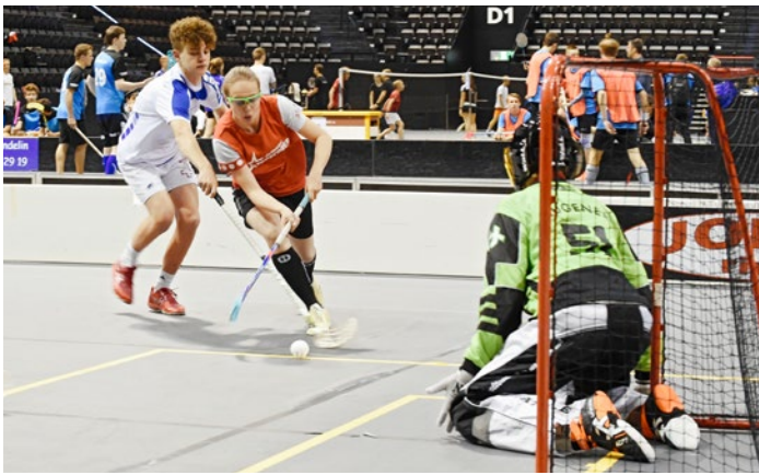
Unihockey gehört zu den beliebtesten Teamsportarten im Schulsport