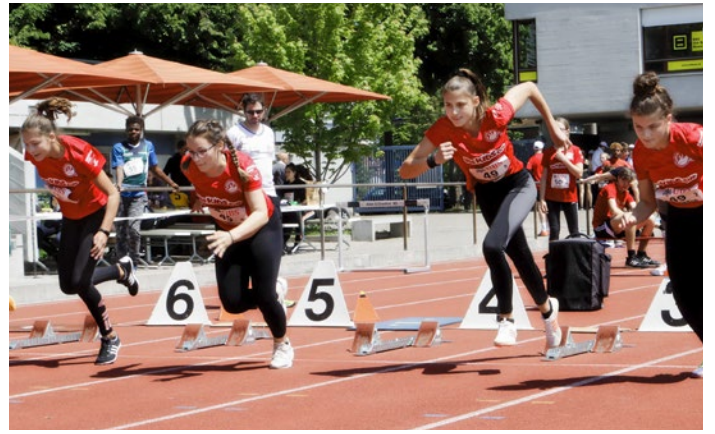
Gemeinsam katapultierten sie sich aus den Startblöcken