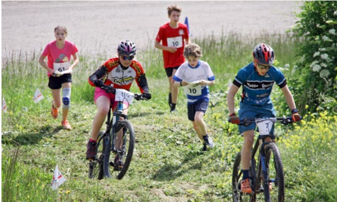
Voll Power den Berg hoch und die OL auf Postensuche