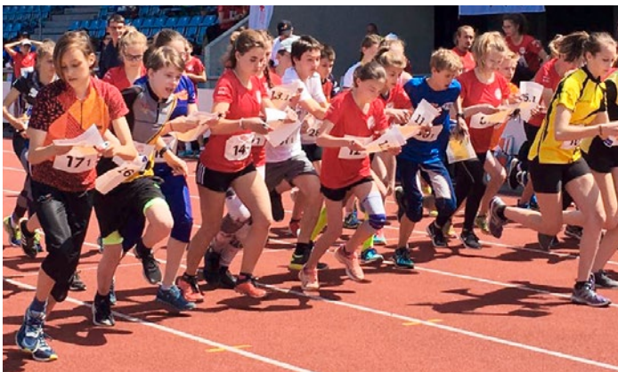
Start zum Team-OL