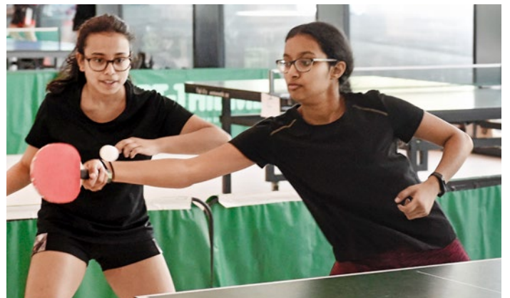
Taktik und volle Konzentration bei der schnellen Ballsportart